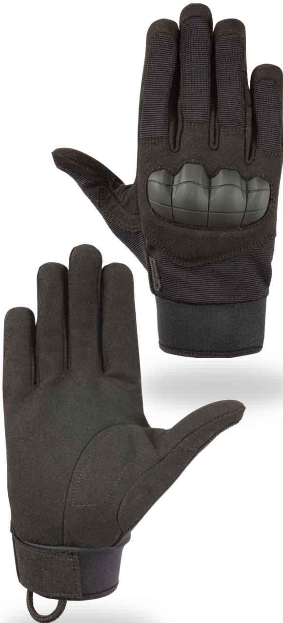
MONA Short Black

Textilní rukavice s vysokou ochranou proti mechanickým rizikům, vyvinuté pro použití v bezpečnostním, policejním a vojenském prostředí.